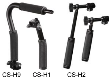
CS-H9 CS-H1 CS-H2

Der CS-H1 ist ein kompakter direkter Griff, der CS-H2 ist ein Teleskophandgriff, die Länge lässt sich im Handumdrehen ändern. Der Handgriff ist um 360° drehbar und dazu 30° seitlich verstellbar. Somit findet jeder Benutzer die bequemste Position. Der CS-H9 ist der Handgriff für bodennahe Aufnahmen.